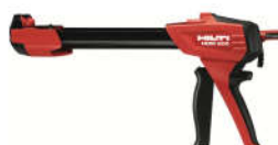
Súng bơm tay HDM