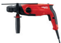
Máy khoan TE 3