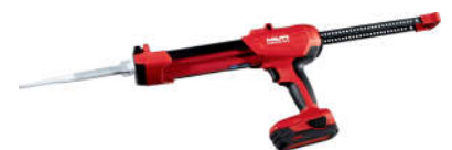
Súng bơm tự động HDE